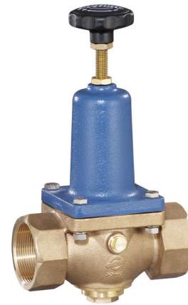
DN 40 - DN 50