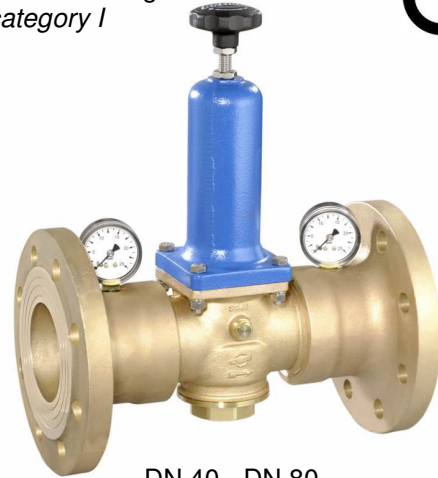
DN 40 - DN 80

(Ausführung DN 65 & 80 mit separaten Manometeranschlüssen / version DN 65 & 80 with separate manometer connections)